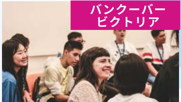
バンクーバー ビクトリア

SSLCのジュニア・サマープログラム「グッドタイムサマー」は、バンクーバーとビクトリア2都市にて開催。「ホームステイ滞在」「フルタイム英語学習」「アクティビティ」を組合せたサマープログラムでしっかり英語を学びながらもカナダを満喫することが可能です。ホームステイ滞在、他国から来る多くの友達、しっかりとした英語学習、カナダを満喫できる多くのアクティビティなど、楽しみながら多くの英語に触れ「カナディアン・ライフ」を満喫します。