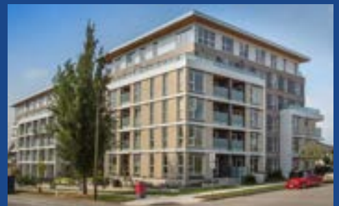
お部屋に限りがございます。お早めにお問い合わせください。

SSLCと同系列であるGECでの滞在アレンジが可能。キッチン付きのホテルタイプ、また5週間以上滞在可能な方にはアパートメントタイプのお部屋のアレンジが可能。家具付き、24時間のセキュリティサービス付きなので安心です。プライベートのキッチン、バスルーム付きなので親子で快適に過ごすことが可能です。